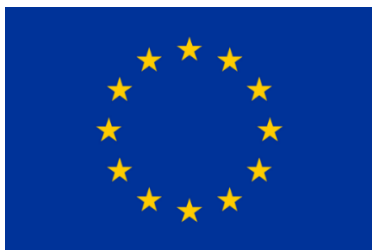
Cofinancé par l'Union européenne

L'emblème avec mention à utiliser est 18 :